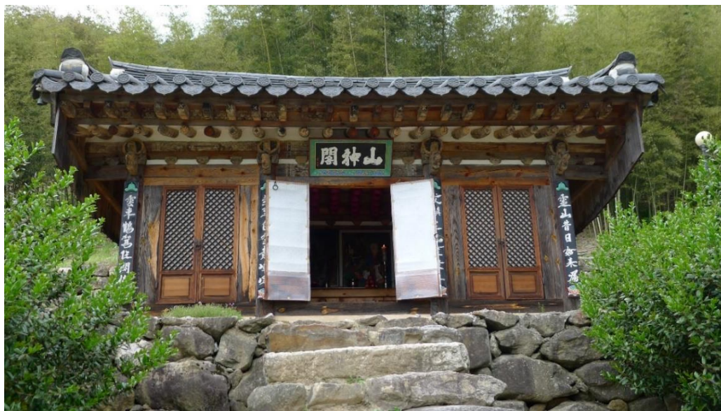
圖 2 實相寺百丈庵山神閣，全羅北道南原市

合併或鄰近類型指建築位置相鄰合併或合併，如仙巖寺、松廣寺、梵魚寺、觀龍寺等，以全南海南郡大興寺、全南順天市仙巖寺為例說明。大興寺為朝鮮後期禪教大伽藍，西山大師清虛休靜駐錫之處，除輩出楓潭義謙(1592-1665年)、霜月璽封(1686-1767年)等十三位大宗師與萬化圓悟(1694-1758年)、影波聖奎(1728-1812年)等十三位大講師外，並有隱居大興寺一枝庵四十餘年，以茶入禪，號稱「海東茶聖」的草衣意恂(1786-1866年)，是朝鮮後期禪僧雲集的大叢林。大興寺伽藍劃分為北院、南院、大光明殿與表忠祠四區，山神閣位於北院，區內有大雄寶殿、白雲堂、應真堂山神閣等建築。山神閣與應真堂兩殿合一(圖 3)，建築為懸山式屋頂、面闊五間、進深三間，正面左側三間為應真堂，右側兩間為山神閣，外懸「應真堂山神閣」匾額，兩殿中間有牆圍堵，應真堂佛壇中央供奉釋迦如來佛、文殊菩薩、普賢菩薩像，兩旁是十六羅漢像(現遺十四尊)、侍者、童子、使者、