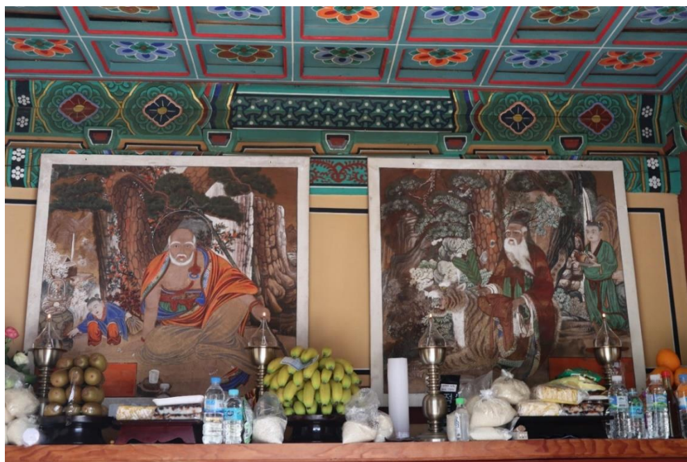
圖 1 鳳巖寺山神閣內所供山神幀(右)和獨聖幀(左)，慶尚北道聞慶市

實相寺百丈庵原稱百丈寺，依〈發掘調查報告書〉述，始建立年代不詳，從境內所遺國寶〈百丈庵三層石塔〉、寶物〈百丈庵石燈〉文物，推測初建在統一新羅晚期。截至十七世紀末期遭受兩次祝融之災前，百丈寺原建有佛殿四所、寮房八間、