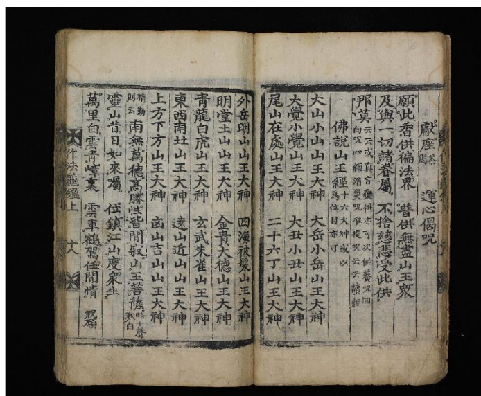
圖 13 《佛說山王經》(01795_0001_0024)，1826 年

朝鮮時期「山王」的稱謂，不僅列於儀式文，且出現於〈山神幀〉榜題、儀式碑石，以及拜禱山神的「山王契」結契。山神圖榜題如 1788 年龍湫寺藏〈隱身庵山神幀〉題「南無大權山王之位」、1820 年孤雲寺白蓮庵〈山神幀〉題「大權山王之影」、嶺南大學博物館藏題「南無山王大神之影」、1872 年〈華嚴寺金井庵山神幀〉題「山王之尊像」、1898 年松廣寺〈山神幀〉題「山王大神之位」、京畿道安城〈雲水庵山神幀〉題「此山局內德高閑山王大神之位」等。碑石或豎立山神閣外，或是鑿刻於石壁上。遺有全南求禮泉隱寺〈山王之位碑〉、全南順天仙巖寺山神閣