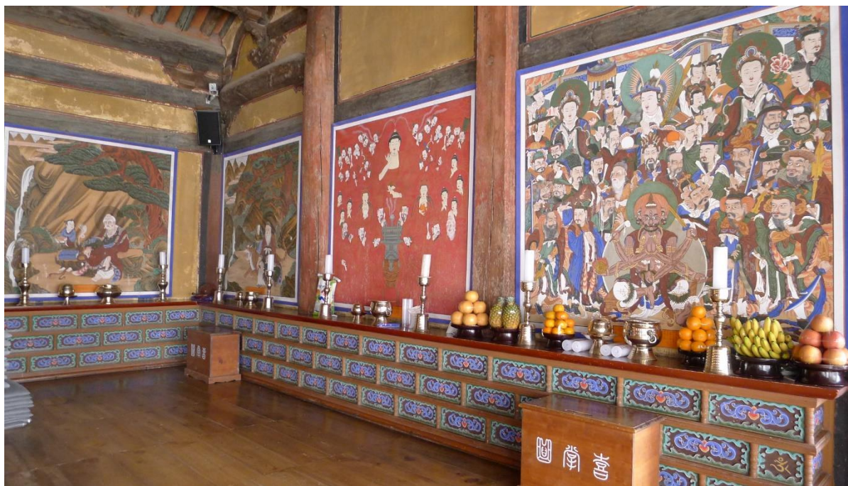
圖 7 修德寺大雄殿中壇佛畫神眾幀、熾盛光如來圖、山神幀、獨聖幀（由右向左）

配殿類型，如全南順天市松廣寺觀音殿、全南求禮郡華嚴寺圓通殿等。松廣寺觀音殿於朝鮮末期作為高宗、明成皇后和世子祈福的願堂，稱祝聖殿，2010 年出版的《曹溪山松廣寺》內載觀音殿內懸掛著 1858 年作〈山神圖〉、1869 年作〈七