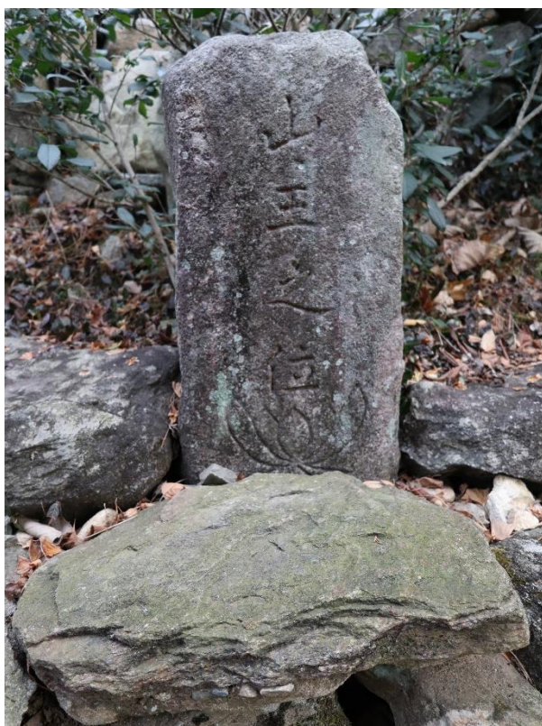
圖 5 仙巖寺山神閣後所立「山王之位」石碑，全羅南道順天市

三聖閣的奉祀手法，盛行於十九世紀以後，儀式作法中，山神與道教北斗星君等神祇共祀，見於 1769 年《諸般文》（鳳停寺刊本）「神眾作法」， 27 關於三聖閣奉祀的形式，有因朝鮮道教科儀萎縮，山神和道教北斗七星信仰被佛教吸收的看法， 28 但