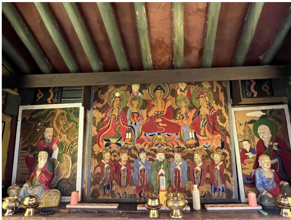
圖 6 鳳停寺三聖閣所供熾盛光如來圖（中）、山神幀（左）、獨聖幀（右），慶尚北道安東市

三崎良周撰〈山王神道と一字金輪佛頂〉中有山王、金輪、七星為同體的見解， 29 山王在韓、日的發展可有不同的跡象，此部分還有討論的空間。