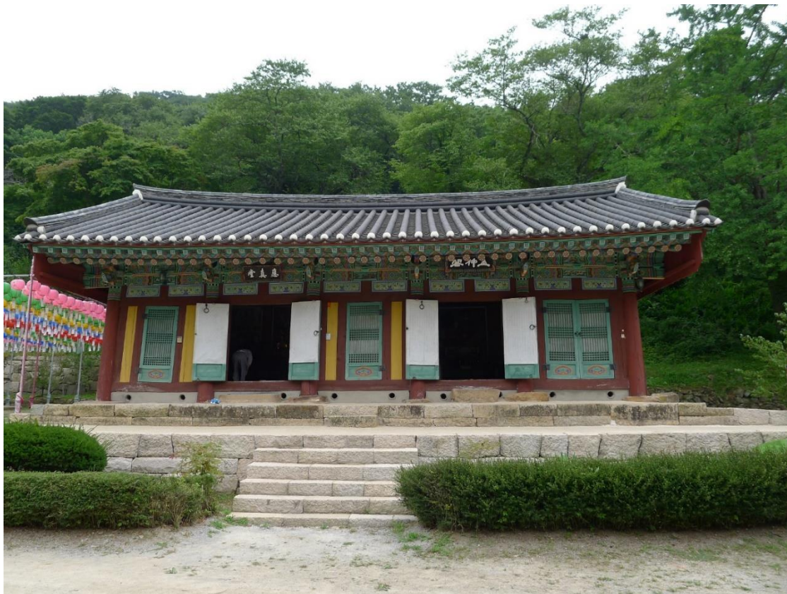
圖 3 大興寺應真堂與山神閣，全羅南道海南郡

仙巖寺山神閣建於禪院區後方，此寺與天台宗淵源甚深，開創海東天台宗的高麗義天（1055-1101 年）曾在此大舉修建伽藍，弘演天台法筵，寺內存有三座高麗僧塔。 25 朝鮮後期諸如栢庵性聰（1631-1700 年）、護巖若休（1664-1738 年）、海鵬展翎（?-1826 年）、涵溟太先（1824-1902 年）、景鵬益運（1836-1915 年）等諸多名僧在此講座弘法，禪風盛行，號稱「湖南第一禪院」。禪院內建有應真堂、彌陀殿、真影堂、達摩殿和山神閣，主殿應真堂內除有十六羅漢像外，又加奉一尊獨聖