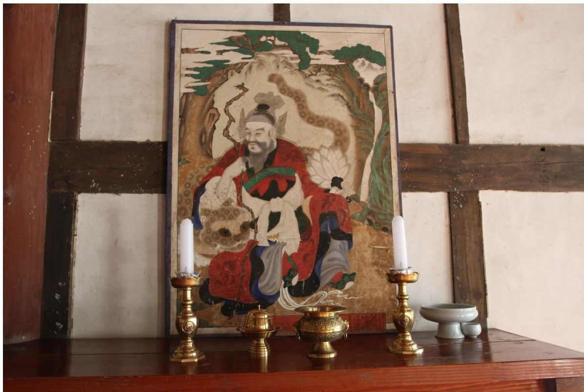
圖 8 華嚴寺圓通殿〈山神幀〉，1897 年作

星幀〉、1907 年作〈獨聖幀〉等幀畫， 32 但 2018 年 12 月筆者調查時，兩側壁面已取下這些佛畫。華嚴寺圓通殿採與大雄殿、影殿、羅漢殿並列一排的伽藍配置，殿內 1897 年作〈山神幀〉(圖 8)，依畫記題：「建陽二年陰曆丁酉二月二十日造成于塔殿，仍以奉安於圓通殿。」，可知是安奉於圓通殿內。