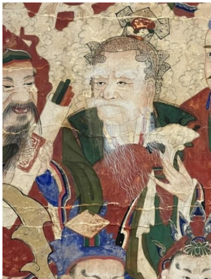
圖9 山神形貌，〈梵魚寺神眾幀〉(局部)，朝鮮1891年，絹本著色，150.8×149.2公分， 梵魚寺聖寶博物館藏