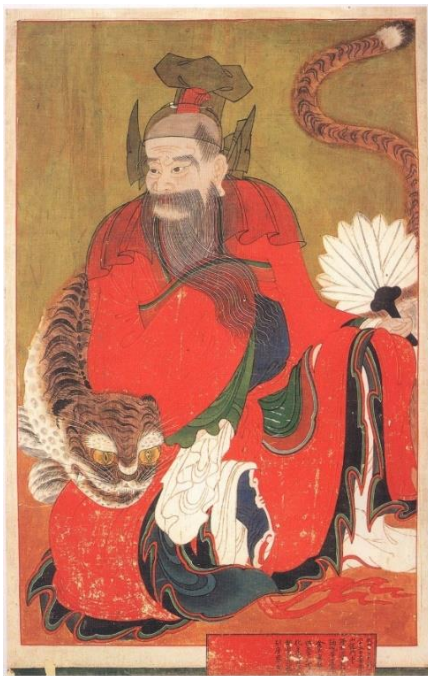
圖10 龍門寺〈山神幀〉，朝鮮1853年，麻本著色，126×79公分，直指寺聖寶博物館藏，圖引用 《한국의불화》9直指寺(聖寶文化財研究院，1996年)，頁119。