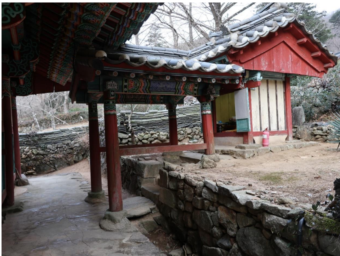
圖4 仙巖寺應真堂與山神閣增築通道，全羅南道順天市

像，山神閣位于應真堂後方，兩建物間築有連結的屋簷、通道，山神閣內奉祀〈山神幘〉，殿後面立有「山王之位碑」(圖4、5)。